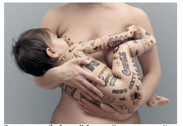
Дигитален принт/билборд на Небуду груп. Инсталиран е на гъгъла "6-и септември"/главната.

в които е легитимна употребата на разума, за да установи, какво може да се знае, какво трябва да се прави, и на какво може да се надява." – Мишел Фуко, Що е просвещението?