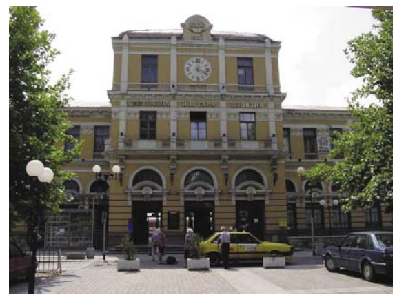
Централната ЖП гара в Пловдив. Видео филмът Stop Motion Studios – Series 13 (Изследвания в наксани движения – Серия 13; на Дейвид Крофърд) и Daily Stories (Делични истории; на Дорел Насре) са инсталирани на електронния панел за реклами във фойето на гарата.