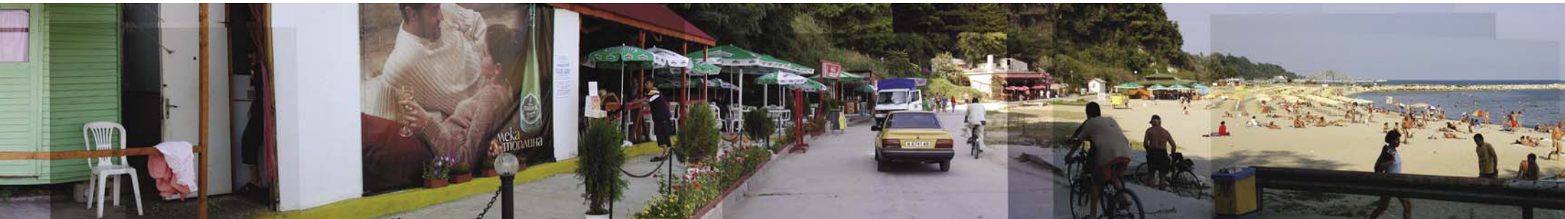
Слоганът на ракията, "мека топлина", на фона на черноморския плаж в разгара на сезона